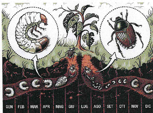
Ciclo di vita della Popillia japonica

Maggiori informazioni: www.fi.ch/organismi